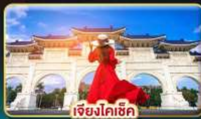
เจียงไคเช็ก