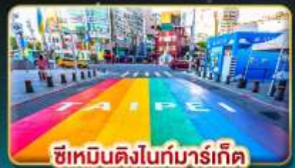
ซีเหมินติงไนท์มาร์เก็ต