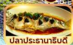
ปลาประรานาธิบดี