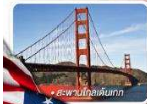
สะพานโกลเด้นเกต