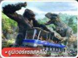
ยูนิเวอร์แซลสคูดิโอ