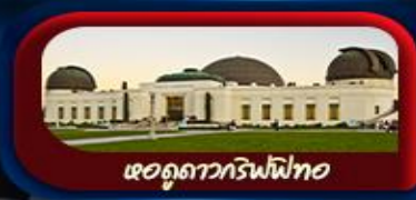
หอดูดาวกริฟฟิท

การันตี 10 ท่านออกเดินทาง พร้อมหัวหน้าทัวร์คนไทย