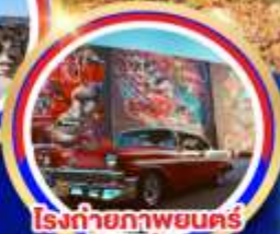
โรงภาพยนตร์ยูนิเวอร์แซล