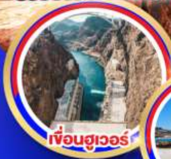
เฟื่องฮูเวอร์

ช้อปปิ้งจิวเอี๊ยท์ลีตออนคาร์นิวัล ช้อปปิ้งบาร์สตาร์เอี๊ยท์ลีต