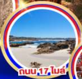
ถนน 17 ไมล์