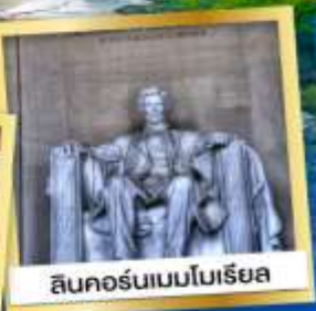
ลินคอล์นเบเนโบเรีย