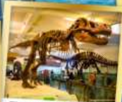
พิพิธภัณฑ์ธรรมชาติ