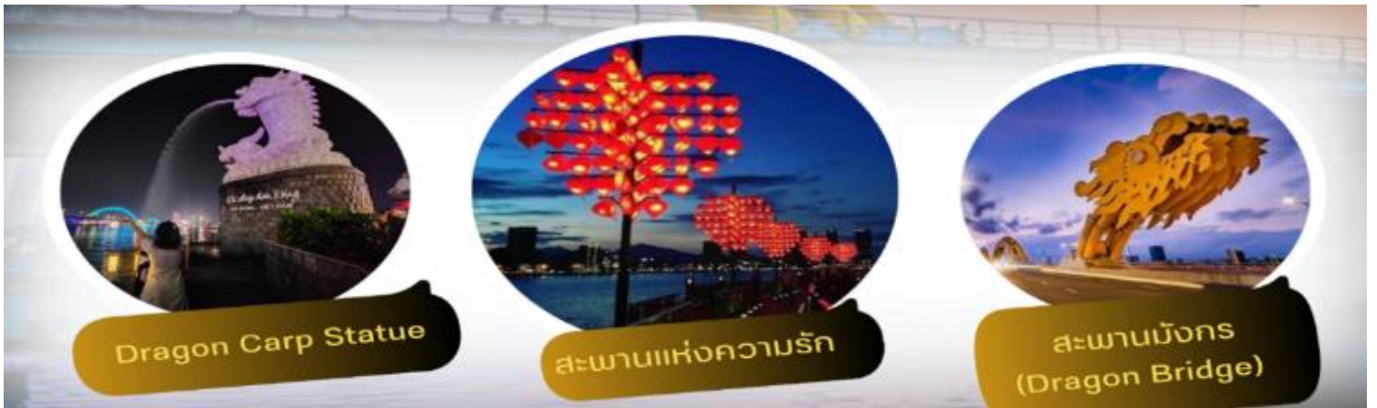
Dragon Carp Statue