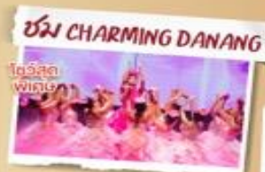
ชม CHARMING DANANG