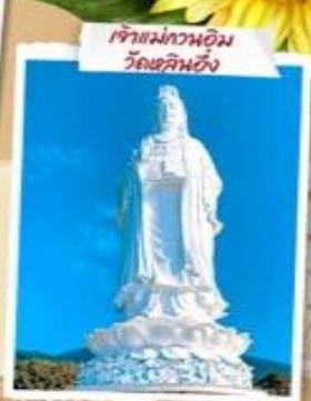
ศาลแม่กว๋อหมี่ วัดชลินฮิ่ง

เที่ยวสวนสนุกจัดเต็มบนบานาฮิลล์ ชมการแสดงสุดอลังการ Charming Danang เก็บครบทุกไฮไลต์ถึง เมืองตานัง ฮอยอัน