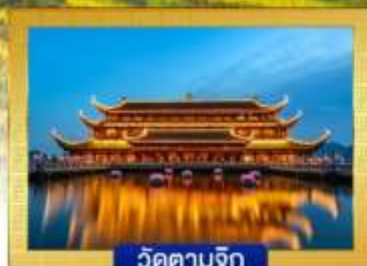
วัดตามจิก