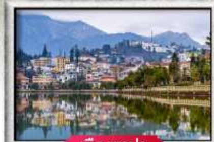
เมืองซาปา