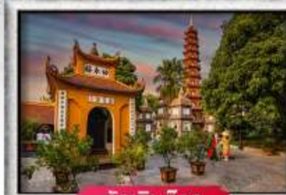
วัดเอนกวิวก