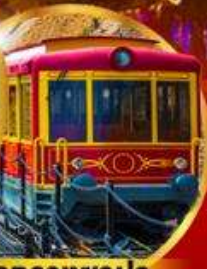
รถรางซาปา