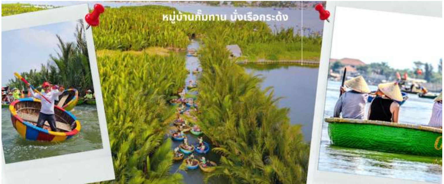
จังหวัดนครศรีธรรมราช

จากนั้นนำท่านผ่านชม ภูเขาหินอ่อน Marble Mountains และนำท่านเข้าชม หมู่บ้านแกะสลักหินอ่อน ที่มีแหล่งวัตถุดิบหินอ่อนเนื้อดี และช่างแกะสลักฝีมือประณีต ส่งออกจำหน่าย ทั่วโลก จากนั้นนำท่านเดินทางสู่ หมู่บ้านกัมทาน สนุกสนานไปกับการเล่นกิจกรรม นั่งเรือกระดัง เป็นหมู่บ้านเล็กๆในเมืองฮอยอันตั้งอยู่ในสวนมะพร้าวริมแม่น้ำ ในอดีตช่วงสงครามที่นี่เป็นที่พักอาศัยของเหล่าทหาร อาชีพหลักของคนที่นั่นคืออาชีพประมง ระหว่างการล่องเรือท่านจะได้ชมวัฒนธรรมอันสวยงาม ชาวบ้านจะขับร้องเพลงพื้นเมือง ผู้ชายกับผู้หญิงจะหยอกล้อกันไปมานำที่พายเรือมาเคาะกันเป็น