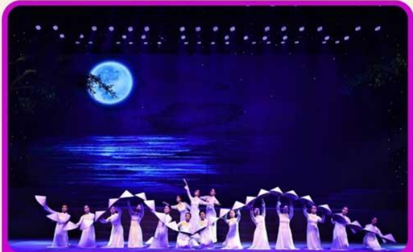
ชมการแสดง Charming Show Danang