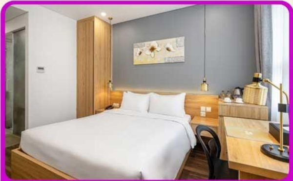
พักเมืองดานัง 4 ดาว 2 คืน