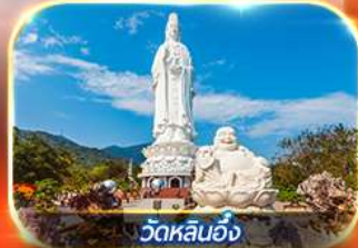
วัดหลันอิ่ง