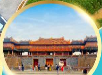
พระราชวังโบราณโคโนย