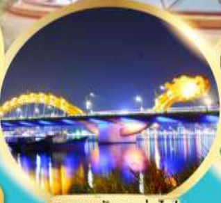
สะพานมังกรพันไฟ