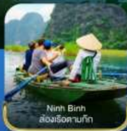
Ninh Binh ล่องเรือตามกัก