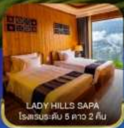
LADY HILLS SAPA โรงแรมระดับ 5 ดาว 2 คืน