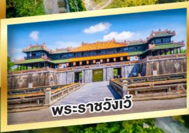
พระราชวังเว้