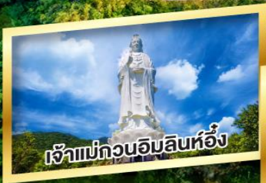
เจ้าแม่กวนอิมสินห่อิ่ง