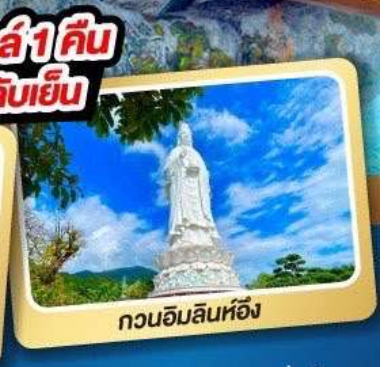
กวนอิมลินห์ฮึง