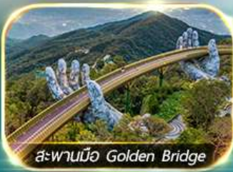
สะพานมือ Golden Bridge