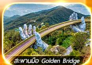
สะพานมือ Golden Bridge