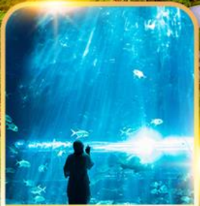
อควาเรียม