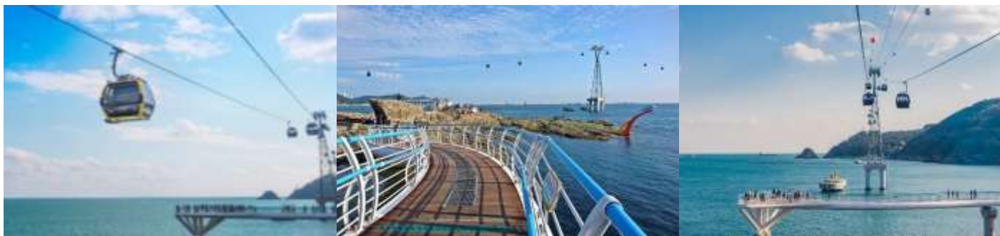
Songdo Yonggung Suspension Bridge